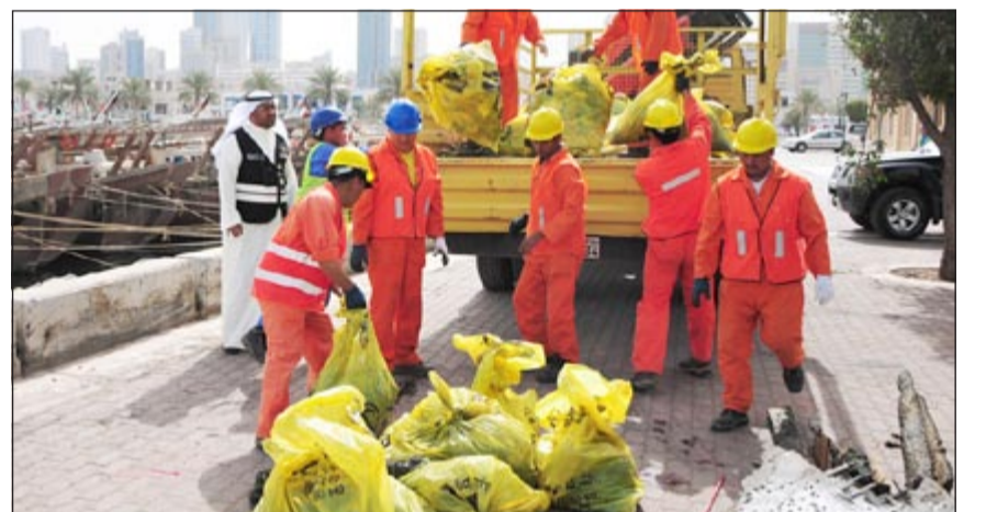
شاحنات البلدية ترفع المخلفات بعد انتشالها من نقعة الشمالان

تم وضعها من قبل البلدية والجهات الحكومية على امتداد السواحل الكويتية وذلك تجنبا للمساءة القانونية وتحقيقاً للمصلحة العامة، مشيرة إلى أنه في حالة وجود أي شكوى عدم التردد بالاتصال على خط البلدية الساخن 139 الذي يعمل على مدار الساعة بهدف خدمتهم والتواصل معهم من خلال الإبلاغ عن أي شكوى