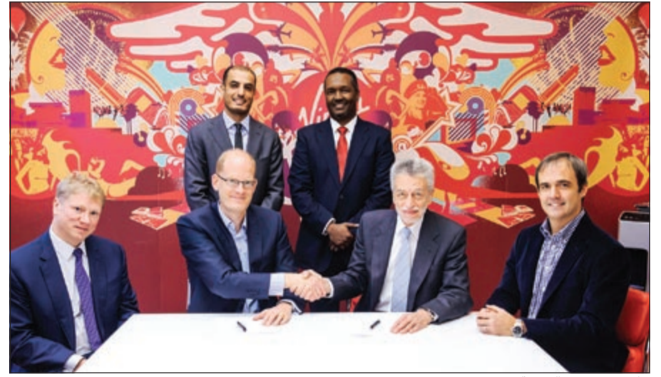
جانب من توقيع الصفقة

أعلنت مؤسسة الخليج للاستثمار أنها ستستثمر 50 مليون دولار في مجموعة فيرجن موبايل الشرق الأوسط وأفريقيا التي تتخذ من دبي مقراً لها. حيث ستجعل هذه الصفقة من مؤسسة الخليج للاستثمار ومجموعة فيرجن أكبر مساهمين في VMMEA التي تتمتع بمكانة متميزة في مجال تشغيل شبكات الاتصالات المتنقلة الافتراضية في منطقة الشرق الأوسط وأفريقيا، فضلاً عن كونها الذراع الإقليمية الحصرية لمجموعة فيرجن القيادية العالمية التي تغطي أنشطتها خمس قارات ويبلغ العدد الإجمالي لعملائها قرابة 20 مليون، وذلك إلى جانب مساهمين عالميين وإقليميين بارزين بمن فيهم: الوطنية لمشاريع التكنولوجيا (NTEC) و Millennium Private Equity. وفي هذه الصدد، قال مؤسس مجموعة فيرجن، ريتشارد برانسون: «إن فيرجن موبايل هي المشغل الرائد لشبكات الاتصالات المتنقلة الافتراضية في الشرق الأوسط وأفريقيا من خلال تواجدها في عمان، الأردن، المملكة العربية السعودية، وجنوب أفريقيا، ونعزّم إنشاء كيان إقليمي ضخم للاتصالات المتنقلة يتجاوز عدد عملائه العشرة ملايين، وتجسد مساهمة مؤسسة مالية مرموقة كمؤسسة الخليج للاستثمار دعماً مهماً لخططنا الطموحة». بدوره، قال