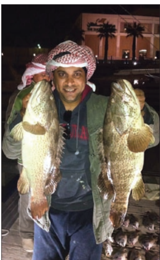
يا عيني على صيدك يا فنان