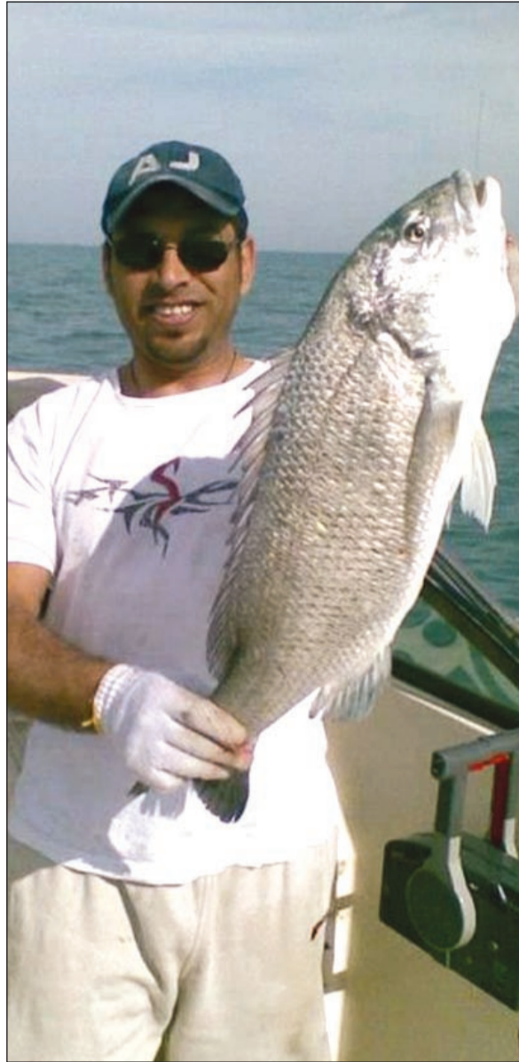
يا سلام هذا السبيطي الطيب