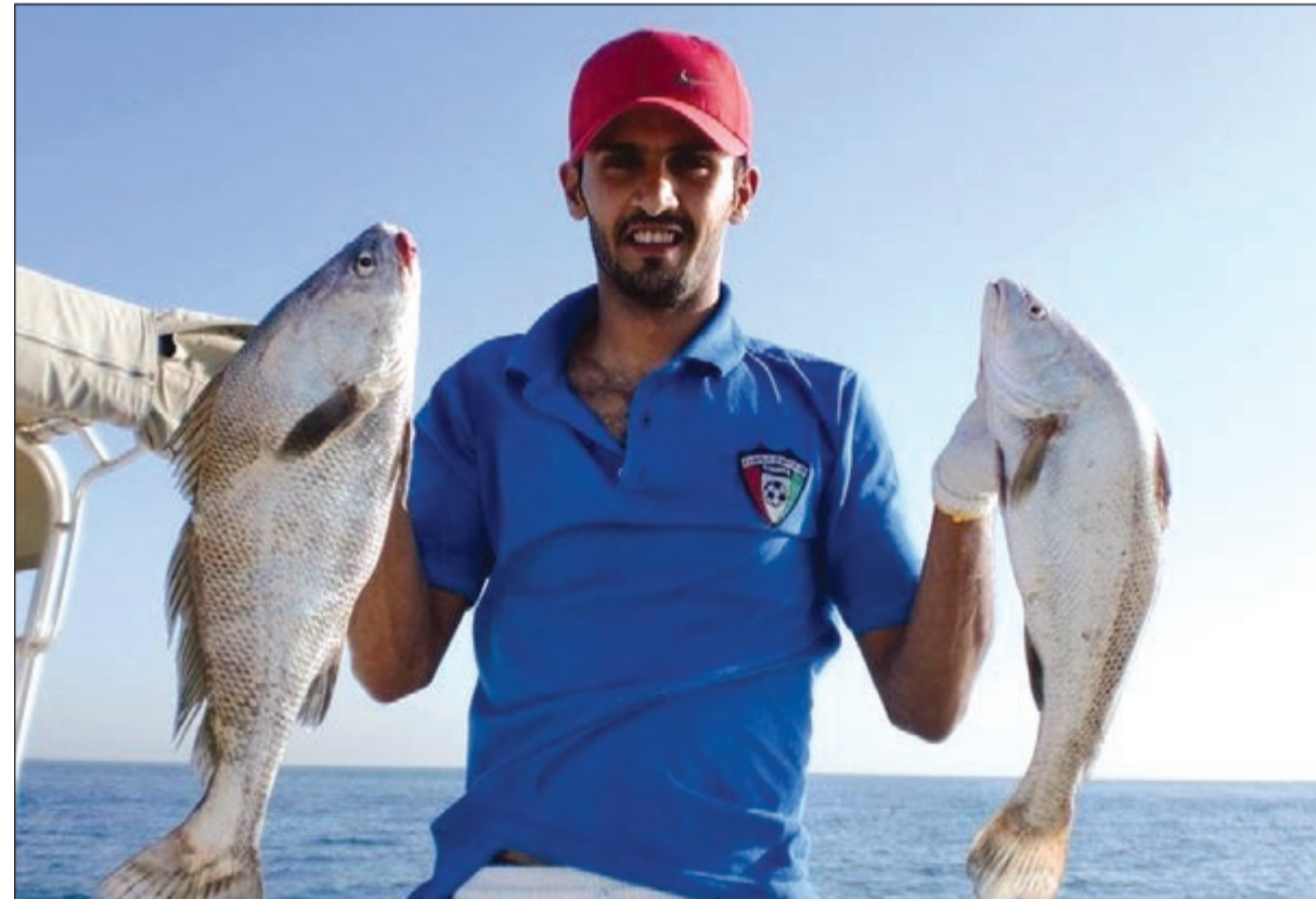
أحلى قروح شمائية

● أحب ان أختم بعدة نصائح لأخواني الحداقة أقول لهم حافظوا على بحرنا واهتموا بعدة السلامة والإسعافات الأولية ودائما ضعوا بالطراد بنزينا وبطارية احتياط وفي الختام أدعو للجميع بالصيد الطيب والسلامة.