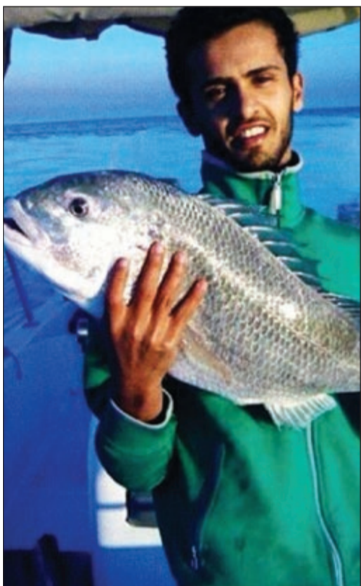
سبيطي ولا أجمل