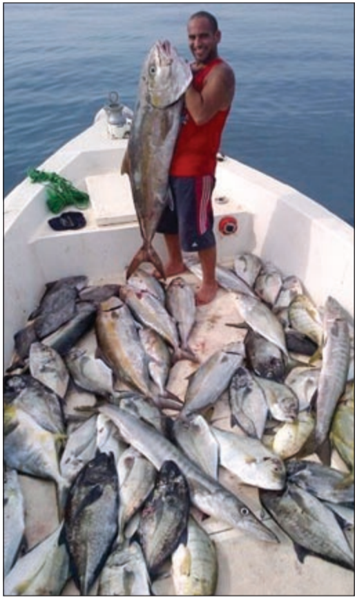
صيد المسدس يعطيك اختيار الأفضل