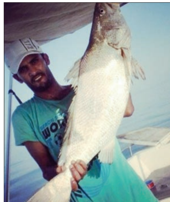
الحداق الشمالية صيدها مختلف