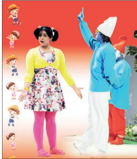
الممثلة بدور «مريوم» مع «سنفور نكي»