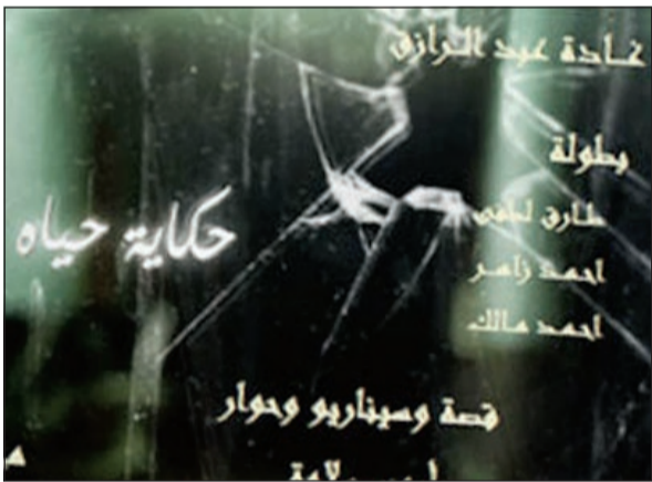
أفيش مسلسل «حكاية حياة» لغادة عبدالرازق