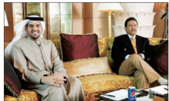
محمد عبده مع حسين الجسمي