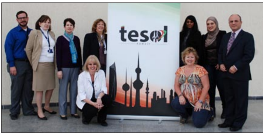
جانب من المشاركين في اللقاء المفتوح الثاني

والكلية الأسترالية في الكويت، وفي أعقاب اللقاء المفتوح الثاني، ارتفع عدد المنخرطين في الجمعية إلى ثلاثمائة عضو. وقد شارك في اللقاء المقام تحت رعاية «جرو مور