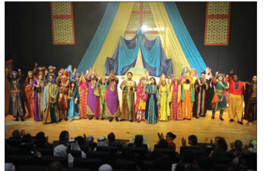
مشهد من مسرحية «الخيزران»

على الثقافات المتنوعة وهذا ما حدث بالفعل مع «لويك».