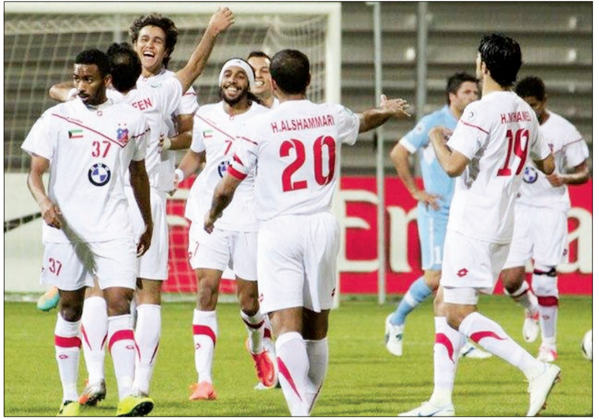
الأبيض يسعى لمواصلة انتصاراته وأفراحه بالفوز على الصفاء اليوم

فعل مع الرفاع في الجولة الماضية. وعلى الجانب الآخر، نجد الصفاء الذي يعلم تماماً أنه الفرق التي بات لها ثقل في القارة الصفراء، لذلك من الطبيعي أن يدخل المباراة بتحفظ كبير ويعتمد على الضغط من وسط الملعب والهجمات المرتدة التي يجيدها لاعبيه دائماً، وفي حال عدم استغلالها فإن نتيجة التعادل تعتبر بمنزلة فوز على أرض الكويت.