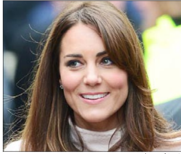
الأميرة كيت ميدلتون

وهي الطريقة التي تستعين بها النجمة غوينيث بالترو، وهي عبارة عن شكل من أشكال الوخز الصيني القديم الذي يتركز على أكواب تدفئة زجاجية فوق نقاط مختلفة على الظهر، وهو ما يعمل على تحفيز الدم وتجديد الحواس.