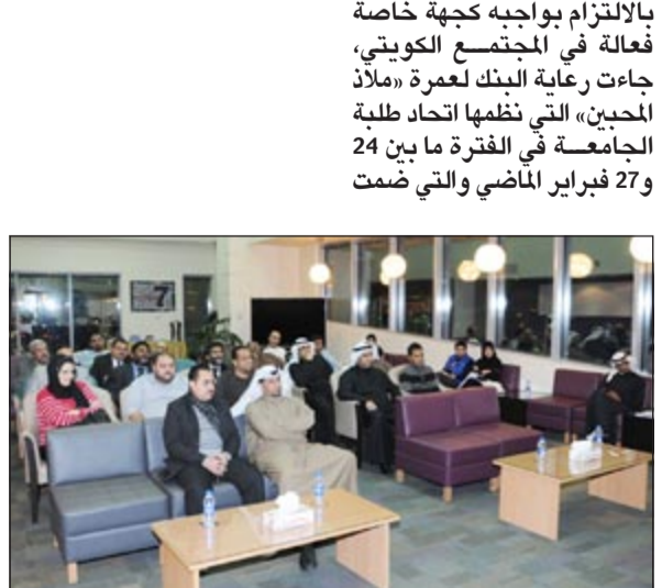
اللقاء التعريفي بعمرة البنك

ويعد بنك بوبيان سياسة تهدف الى توثيق أنشطته