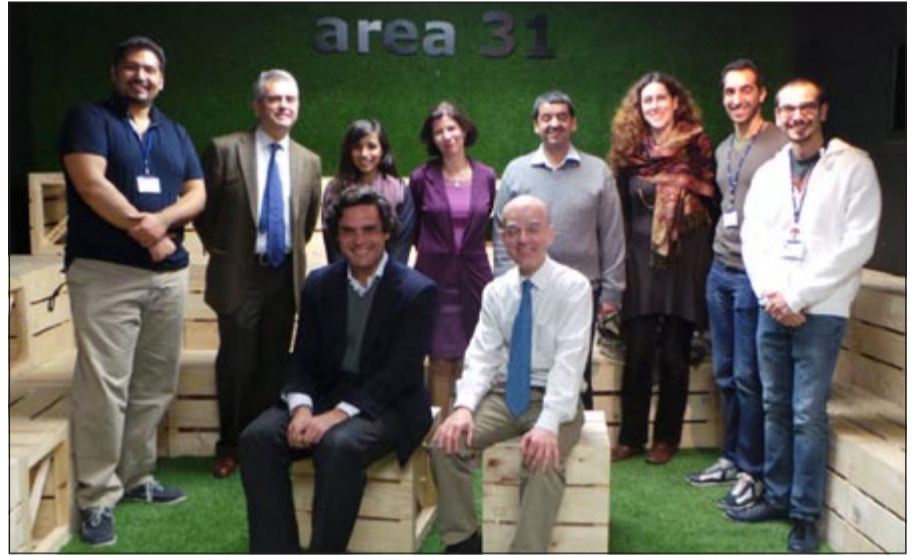
اللجنة المسؤولة من «زين» مع اساتذة ومسؤولين من جامعة IE الإسبانية

في العملية التنموية التي تشهدها الكويت. وختمت «زين» أنها ستظل تولى أهمية بالغة لتطوير الموارد البشرية وصقل مهارات الشباب، من خلال استثمار طاقاتهم وإبداعاتهم ومساندتهم لدخول معترك الحياة العملية ومنحهم الفرص المناسبة.