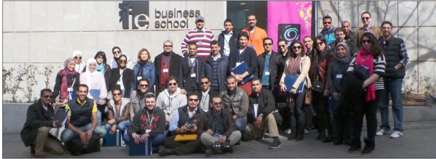
الشباب أصحاب المشاريع