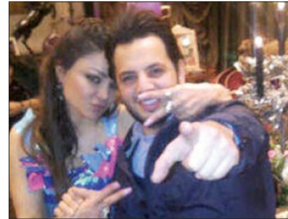
هيفاء وهبي مع نيشان أثناء الاحتفال بعيد ميلادها

عالمية وبالفعل بدأت الحملة في السادس من الشهر الجاري بتغريدة باللغة الإسبانية تليها أخرى في اليوم الموالي باللغة الإيطالية ثم غردوا 8 الجاري باللغة التركية كل تغريداتهم وصلت للعالمية كما خططوا له في السابق. وبالرغم من تغريد العالم هذه الفترة احتفالاً باليوم العالمي للمرأة، إلا أنهم استطاعوا أن يحتفلوا بالمرتبعة الأولى ويترفعوا بحسب موقع «دنيا الوطن» على عرش الـ «تويتر».