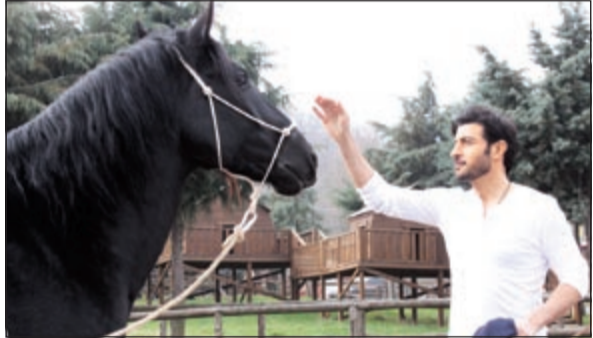
ماجد المهندس في الكليب

أن قام بتدريبات خاصة على ركوب الخيل، وعلى المشاهد التمثيلية لمدة شهر. كما استخدم المخرج فائق حسن في تصوير بعض مشاهد الكليب طائراً عمودية هليوكوبتر، ومعدات تصوير خاصة، لإخراج العمل بأسلوب إخراجي مبتكر.