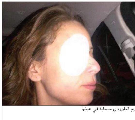
ريم البارودي مصابة في عيناها

حرص الإعلامي اللبناني نيشان على مشاركة مواطنته وصديقه النجمة هيفاء وهبي الاحتفال بعيد ميلادها. وبسدت هيفاء في صور عيد الميلاد التي نشرها نيشان في أسعد حالاتها، على الرغم من أنه أول عيد ميلاد لها بعد انفصالها عن زوجها السابق رجل الأعمال المصري أحمد أبو هشيمة، كما نشر صورة لعلبة شوكلاته باسم «هيفاء». وبيدورها، شكرت النجمة اللبنانية محبيها على تهنئتهم