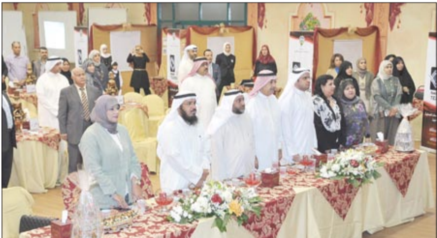
جانب من الحضور (أسامة أبو عطيمة)

التربوي من خلال تطوير مدارك الطلبة والطالبات وفقا للفلسفة التربوية الحديثة التي تنهجها دول العالم المتقدمة. واكد الشريفة ان الوزارة عاكفة حاليا على تطوير هذه الاستراتيجية القائمة على التعليم الإلكتروني وسيتم الإعلان عنها قريبا عبر تبني الوزارة رسما لمبادرات من أهل الميدان بهذا الصدد تحمل جهود وأفكار وإبداعات خلاية، منوها بجهود القائمين على هذه الغاية والتي تتم عن حسن والمسؤولية تجاه أبنائنا.