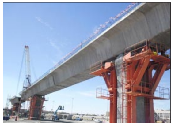
جانب من أعمال مشروع تطوير طريق الجهراء

ولفت م.حسان إلى أن أعمال تركيب القطع مسبوقة الصب بدأت في المرحلة الثانية عند منحدر دوار الأمم المتحدة، فقد تم تركيب أولى قطع مسبوقة الصب والتي تم تصنيعها في ساحة الصب بمنطقة الدوحة على مساحة 150000 متر مربع بعيدة عن أي تجمعات سكانية وهي تعد من أضخم المصانع لتصنيع ومعالجة وتخزين قطع الكابولي المتوازن-Balanced التي هي عبارة عن تركيب قطع الجسور بتعكس حول الركيزة الرئيسية فوق