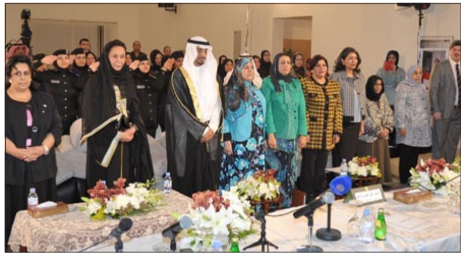
الشيخة لطيفة الفهد ود.محمد الطبطبائي في مقدمة الحضور

أكدت رئيسة مجلس إدارة الجمعية التطوعية ورئيسة لجنة شؤون المرأة، رئيسة الاتحاد الكويتي للجمعيات النسائية الشبيخة لطيفة الفهد أن طموح المرأة مازال كبيراً، مبدية أملاً في أن يتحقق هذا الطموح ومعربة عن فخرها بالمرأة الكويتية التي أصبحت نائبة ووزيرة ومشددة على أنها وصلت إلى ما هي عليه بالكفاءة والجدارة.