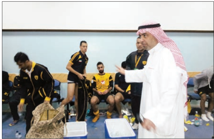
الشيخ خالد الفهد مجتمعاً مع اللاعبين بعد مباراة النصر