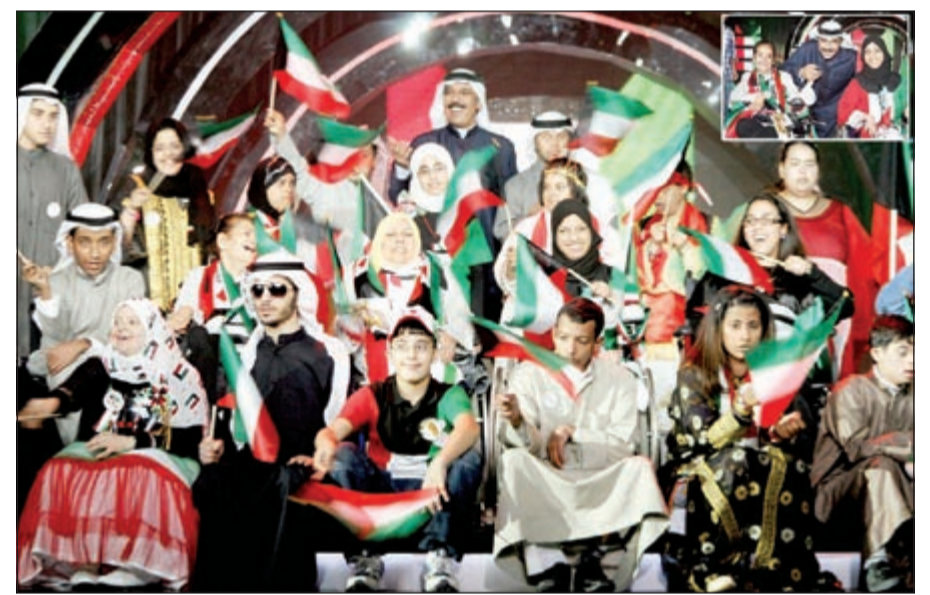
صورة ارشيفية لأوبريت وطني بمشاركة طلاب التربية الخاصة والمعاقين