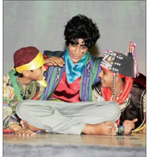
مشهد من مسرحية «همام في بلاد الشلال»

فكرة المسرحية بسيطة جدا وتحت على التعاون والشجاعة والتغلب على العقبات التي يصادفها البشر لتحقيق ما يريدونه، وذلك من خلال حكاية الأميرة ليالي