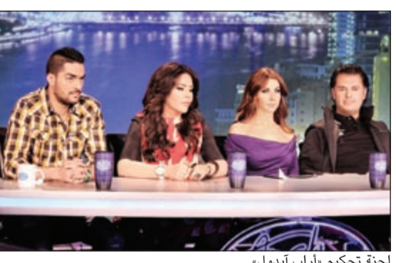
لجنة تحكيم «أراب آيدول»

بيروت، حيث شارك عدد كبير من اللبنانيين ومن جنسيات مختلفة. وبدأت الأصوات اللبنانية بتجارب أدائها، حيث أثنت أيضا اللجنة على الأصوات القوية والجمالية في بداية المرحلة وكان من الواضح انسجام راغب ونانسي واتفاقهما على قبول المشتركين، حيث جعلها ووافق على انتقال أحد المواهب «كرمال نانسي بس»، وفي المقابل أحلام وحسن اتفاقا في الكثير من المواقف وأصبحت اللجنة منقسمة إلى الفريقين.