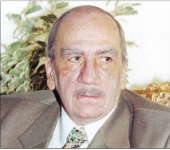
مؤسس مسرح الطفل في الكويت الكاتب القدير محفوز عبدالرحمن

تكرم رائدة مسرح الطفل الكاتبة القديرة عواطف البدر صباح اليوم مؤسس مسرح الطفل في الكويت الكاتب المصري القدير محفوز عبدالرحمن لعطاءاته الكبيرة للحركة المسرحية الكويتية في مسرح الطفل، وذلك في مقر المركز الإعلامي بفندق كوت يارد الساعة 11 صباحا وسيتم حفل التكريم حوار مفتوح للصحافة الكويتية مع الكاتب القدير محفوز عبدالرحمن حول مسرح الطفل في الماضي والوقت الحالي.