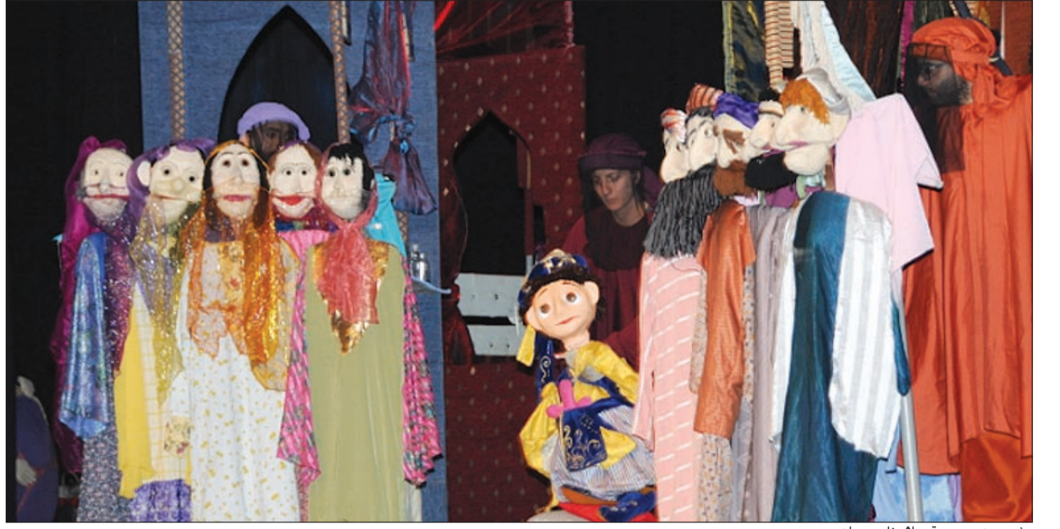
مشهد من مسرحية «يلا ينام مرجان»