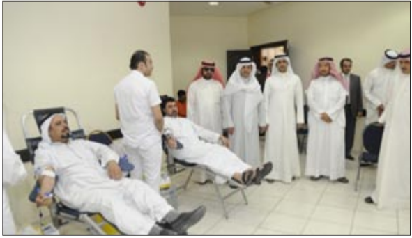
جانب من حملة التبرع بالدم

وبين أن الجمعية خصصت صالة الأفراح التابعة لها لاستقبال المتبرعين في الـ 4 من مارس الجاري، وكان الإقبال لافتا للأنظار، حيث توافد أبناء منطقة النسيم للتبرع بالدم في رسالة واضحة بضرورة دعم جهود البنك الرامية إلى توفير مخزون يساعد المصابين في وقت الأزمات. وذكر أنه تم خلال هذا اليوم استقبال جميع المتبرعين والاهتمام بهم، وتوزيع المياه المعدنية والعصائر، وتوفير كافة المستلزمات الخاصة بالحملة، لضمان تادية العمل على أكمل وجه وعدم السماح بوجود أي عائق أمام الأهداف