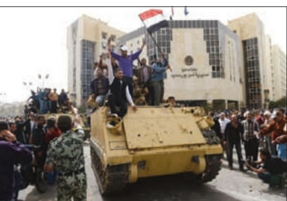
مصريون على ظهر مدرعة يرفعون العلم ترحيباً بدخول الجيش إلى بورسعيد

القاهرة - وكالات: عشية الحكم في قضية مجزرة بورسعيد والذي راح ضحيتها 74 من مشجعي النادي الأهلي المصري العام الماضي، والذي من المتوقع أن يكون الحكم فيها بتأييد إعدام المتهمين الواحد والعشرين، تسلم الجيش المصري أمس رسماً مهام تأمين المقار السياسية والأمنية والمراقب الحيوية بمحافظة بورسعيد بعد انسحاب قوات الشرطة منها. وقامت وحدات من الجيش الثامن الميداني المصري بالانتشار في محافظة بورسعيد، حيث دفعت باليات مدرعة إلى محيط مبنى المحافظة ومديرية الأمن ومقار الأجهزة الأمنية والطرق المؤدية إلى قناة السويس. وكانت قوات الأمن المركزي ببورسعيد انسحبت