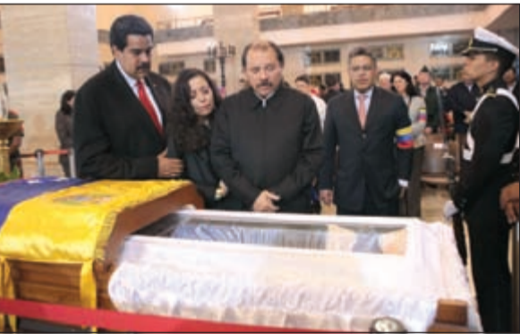
رئيس نيكاراغوا يلقي النظرة الأخيرة على جثمان تشايفز (روبرتز)

كاراكاس- وكالات: بمشاركة مئات الآلاف من الفنزويليين ورؤساء أكثر من ثلاثين دولة تم تشييع الزعيم الفنزويلي هوغو تشايفز الذي سيستم تحنيطه مثل الزعيم الصيني ماو تسي تونغ والزعيم السوفييتي فلاديمير لينين. كما أعلن نائب الرئيس الفنزويلي نيكولاس مادورو، مضيفاً أن الجثمان سسيبق «سبعي سبعة أيام إضافة على الأقل» وقال: «نريد أن يسراه كل الذين يرغبون في ذلك».