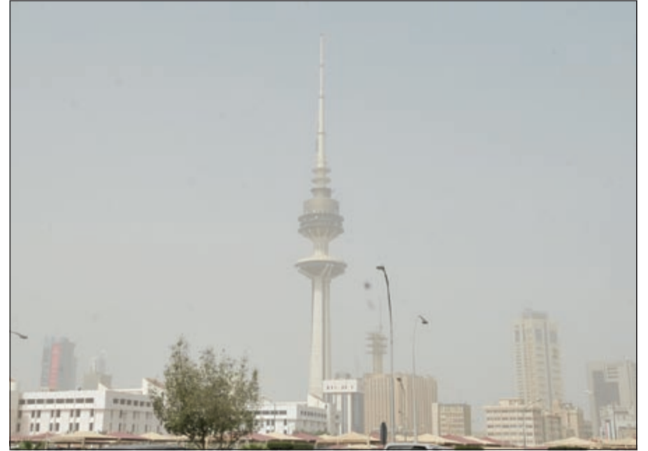
(إسامة أبو عطية)