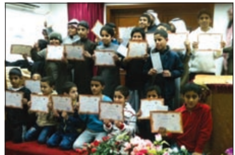
الشاركون من المهدييات والمهدين

برعاية الشيخ فيصل الحمود المالك الصباح ويهدف تثبيت الإيمان في قلوب المسلمين الجدد سيرت لجنة التعريف بالإسلام قافلة أهل الفضل والأحسان برحلة العمرة المهديين الجدد من امام فرع المنقف تحمل على متنها (50) شخصاً من المهديين والدعاة والاداريين، وافياد مدير اللجنة منيف العمري بأن هذا المشروع تقوم به اللجنة 3 مرات في العام ومدة الرحلة اسبوعاً وتتكلف 90 دك لكل مهتد.