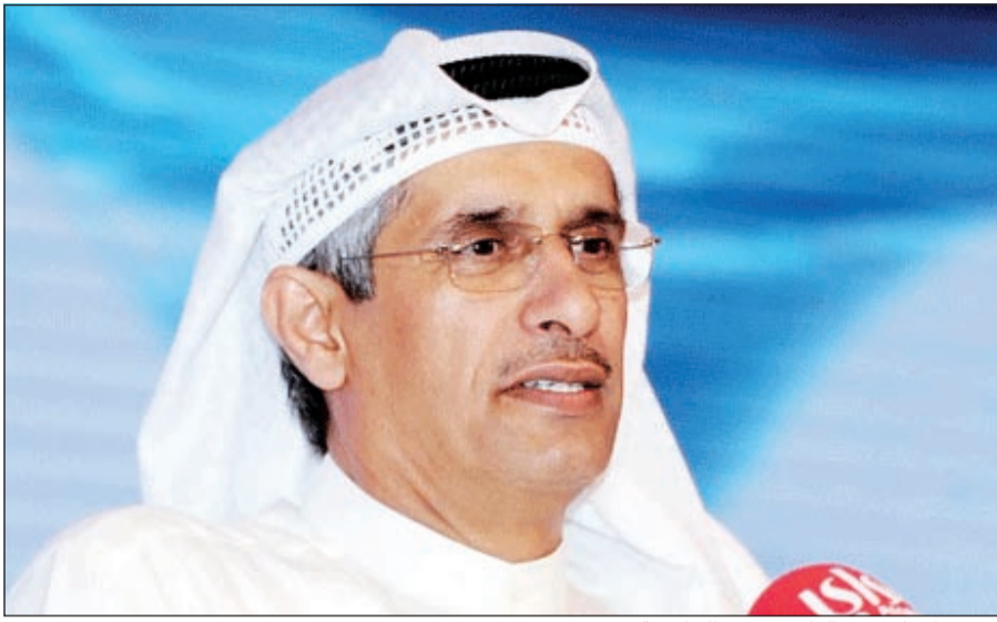
مدير عام تلفزيون الراي يوسف الجلاهمة

يضع المشاهدين و رغباتهم هدفا أساسيا له، لذلك يكون الحرص على تقديم مادة إعلامية راقية