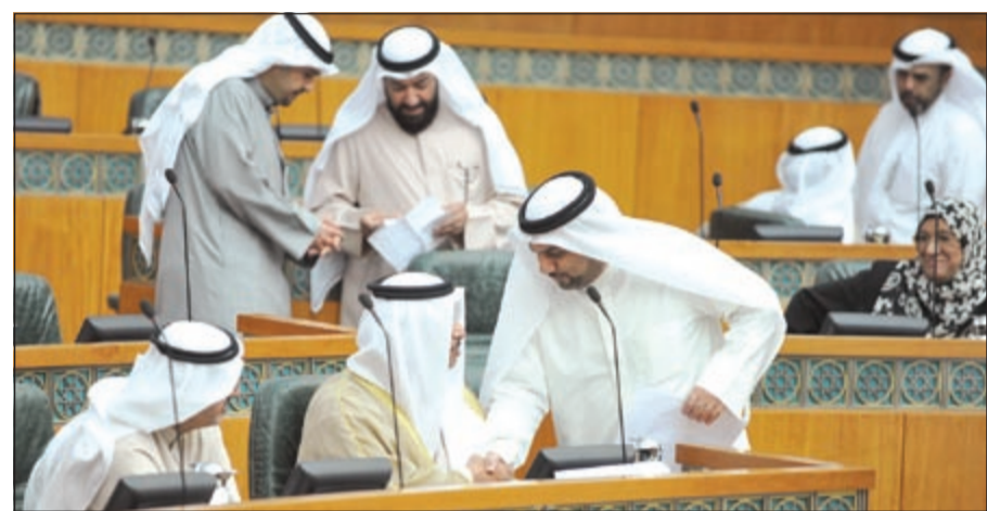
سمو الشيخ جابر المبارك يستمع إلى حديث من د. يوسف الزليخة بحضور م. عبدالعزيز الإبراهيم (متين غوزال)

الشهرية عن 40% من الراتب وبيحت يتبقى للمقترض 60% من الراتب الشهري. 3 - من يتقدم بشكوى من المقترضين بعد تاريخ 2008/4/1 إلى البنك المركزي، فإذا ثبت بعد متابعة الشكوى أن هناك مخالفة لتعليمات البنك المركزي سيتم إسقاط أصل القرض والغرامة عن المقترض مع توقيع غرامة 50 ألف دينار على البنك. 4 - بالنسبة للموظفين الذين تقاعدوا وتالياً انخفض الدخل الشهري لهم، ستتم إعادة جدولة القرض بحيث لا يزيد القسط عن 40% من الراتب وبيحت يبقى للمقاعد 60% من معاشه الشهري. 5 - رفع نسبة الاقتراض للمقترضين إلى 40% من الدخل الشهري بدلاً من النسبة الحالية البالغة 30%. 6 - لن يتم إنشاء صندوق جديد وسيتم تغيير مسمى صندوق المعسرّين إلى صندوق الأسرة. واختتم د.الزليخة تصريحاته الخاصة لـ «الأنباء» بأن مشروع القانون الجديد لن يكلف ميزانية الدولة ديناراً واحداً.