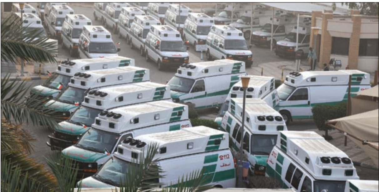
سيارات الإسعاف الجديدة بعد تسلمها

ذكرت صحيفة «حرييت» التركية أمس أن موظفين في وكالة الاستخبارات المركزية الأميركية (سي.أي.إيه) اقتادوا سليمان أبوغيث صهر أسامة بن لادن إلى الولايات المتحدة بعدما اعتقل في أنقرة نهاية يناير الماضي وطردته تركيا إلى الأردن. واحتجزت السلطات التركية أبوغيث لأكثر من شهر بعد أن أفرجت عنه محكمة في أنقرة وقررت وضعه تحت الرقابة الأمنية، وطردته الشرطة التركية إلى الأردن التي كان سيتوجه منها إلى الكويت، لكن الـ «سي.أي.إيه» اعتقلته على الأراضي الأردنية وأقتادته إلى الولايات المتحدة.