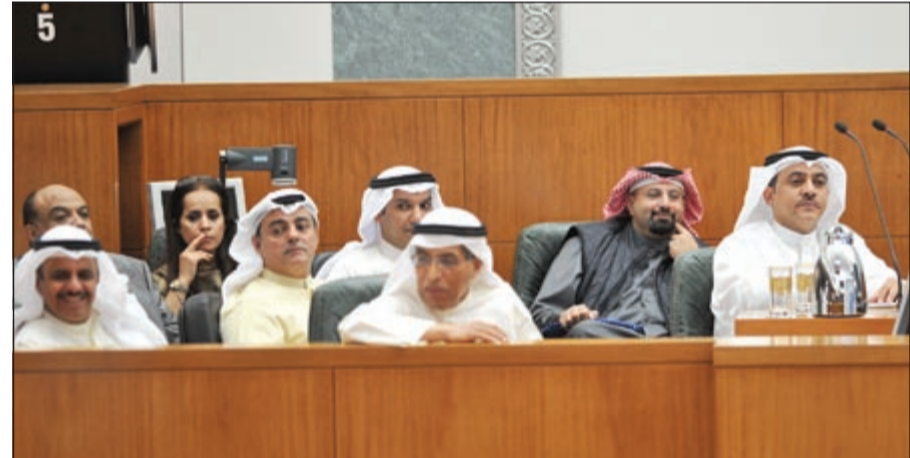
م. سالم الأذينة واركاب وزارة الإسكان وبنك التسليف خلال جلسة مجلس الأمة الخاصة أمس (متين غوزال)