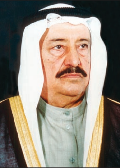
سمو رئيس الحرس الوطني الشيخ سالم العلي

الشيخ سالم العلي في «الأميري» لإجراء فحوصات طبية معتادة