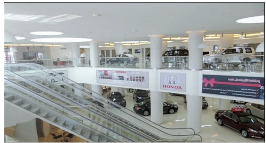
المعرض الجديد من الداخل

وأكدت الشركة أن معرض هوندا الجديد في الشويخ (في مجمع التلال) هو أحد الخطط التوسعية التي تسعى شركة المطوع والقاضي إلى المضي بها لخدمة عملائها وتلبية لتطلعاتهم في الحصول على خدمات متكاملة ومتميزة. وكشفت «المطوع والقاضي» عن خططها القادمة في تجديد معرضها الكائن في «الري» ليكون هو الآخر أحد أفضل وأحدث معارض هوندا في المنطقة.