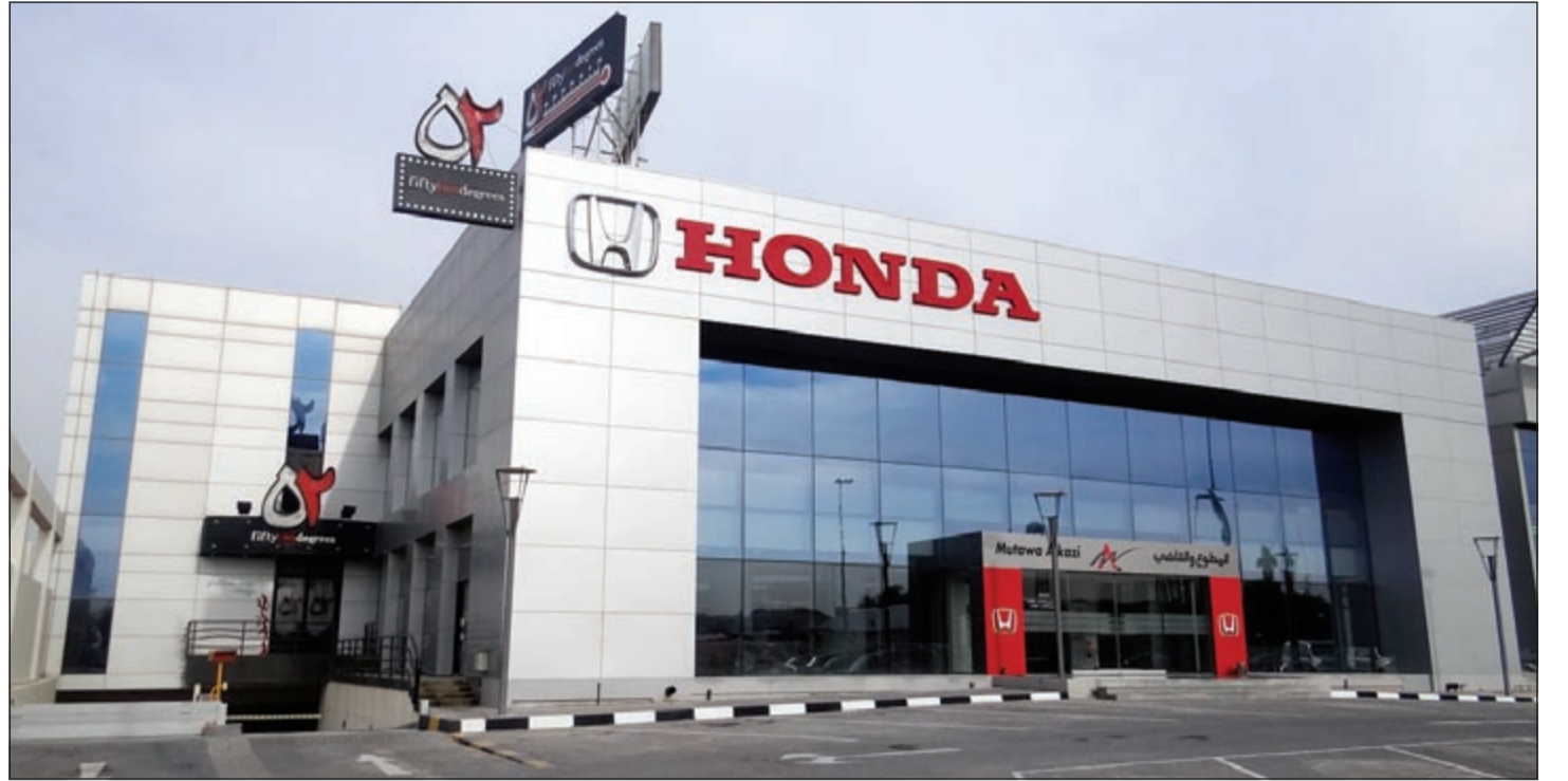
معرض «هوندا» الجديد بمجمع التلال

وتتسارع هذه السيارة من صفر إلى 100 كلم في الساعة بوقت قياسي يبلغ 6,3 ثوان، وبالتالي سيارة MINI John Cooper Works GP