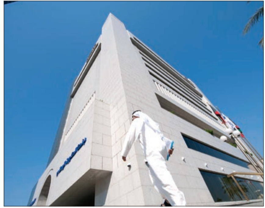
«الوطني» هو البنك العربي الوحيد الذي يحتفظ بموقعه ضمن هذه القائمة لسبع مرات متتالية

من البنوك العالمية الكبرى خلال هذه الفترة مثل بي ان سي باربيا ودويتشه بنك وكريديه سويس وبنك باركليز وكريديه أجريكول وغيرها.