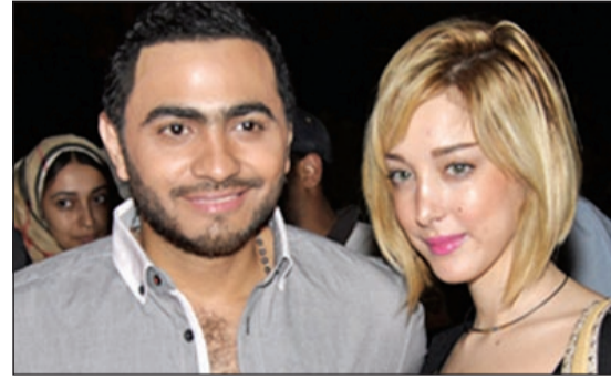
تامر حسني وزوجته