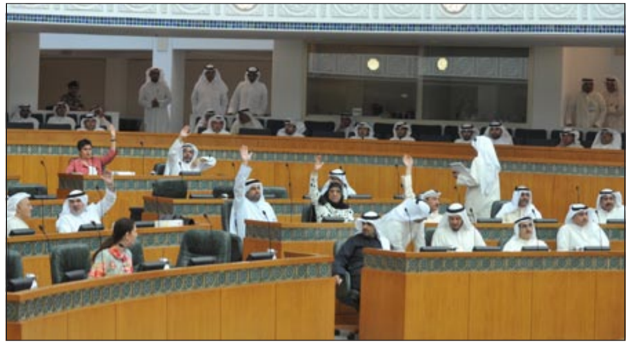
الجلس يصوت على أحد القوانين

المشروع أتى بصورة مستعجلة وصياغته ركبكية جدا وليست واضحة وتؤدي إلى لبس في تنفيذها وأطلب عودة اللجنة وأنا اتحفظ على إنشاء الشركات. صفاء الهاشم «مقرر»: هذا مرسوم غير قابل للتعديل وهذه المشاريع تأخذ وقتا ليبن مردوها. مصطفى الشمالي: أنا لا أعلم ما هو اللبس والمواد واضحة ولن يتكلف المواطن ويجوز لمجلس الوزراء أن يصدر قرارا لإعفاء المواطنين من الإكتتاب. أحمد المليفي: كلام الوزير نفهمه وحديثه لا يتعكس على الحوار. الرئيس: واضح الاختلاف على الصياغة مو على الفكرة. عدنان المطوع: كنا ننقد أن المجلس السابقة أنها لن تستطيع تأسيس الشركات وبعناقد حل المشكلة يتم عن طريق تأسيس الشركات، والعاقد والاستثمار يعود على المواطن نفسه وهذه أول وحدة وهناك أربع شركات بنفس المسائل. وأكد أن هذه الشركات يجب الاستعجال بها والأهم أن تكون المناقصات شفافة. الرئيس: انتهى الوقت وليس هناك نصاب للتصويت لذلك ترفع الجلسة.