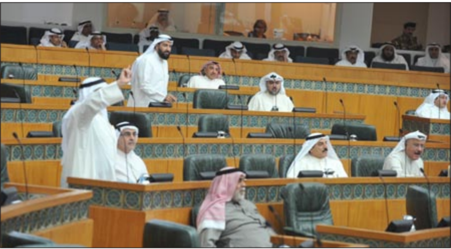
جانب من جلسة أمس