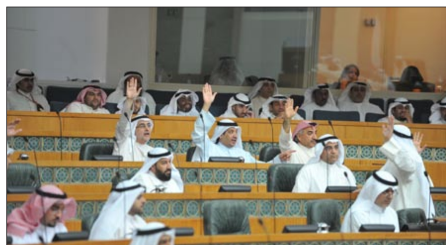
جانبا من جلسة أمس

مدراس الكويت وتفاعس الوزارة في محاسبة المنسبب في هذه القضايا.