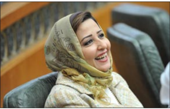
.. ثم تنهي حوارها مع أحد النواب بإبتسامة أيضا