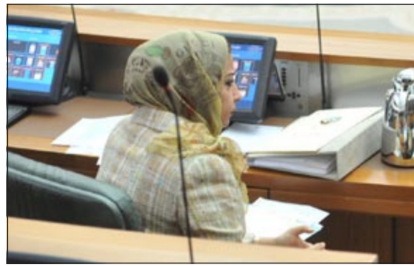
.. وتجلس في القاعة