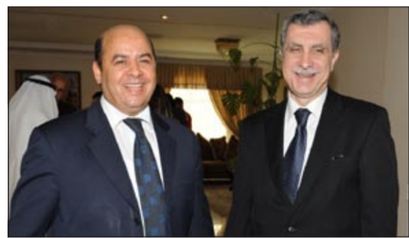
السفير التونسي الصغير الفطناسي وديبسام النعماني

وقال «السوداء امر صعب حيث سترك المكان والأشخاص