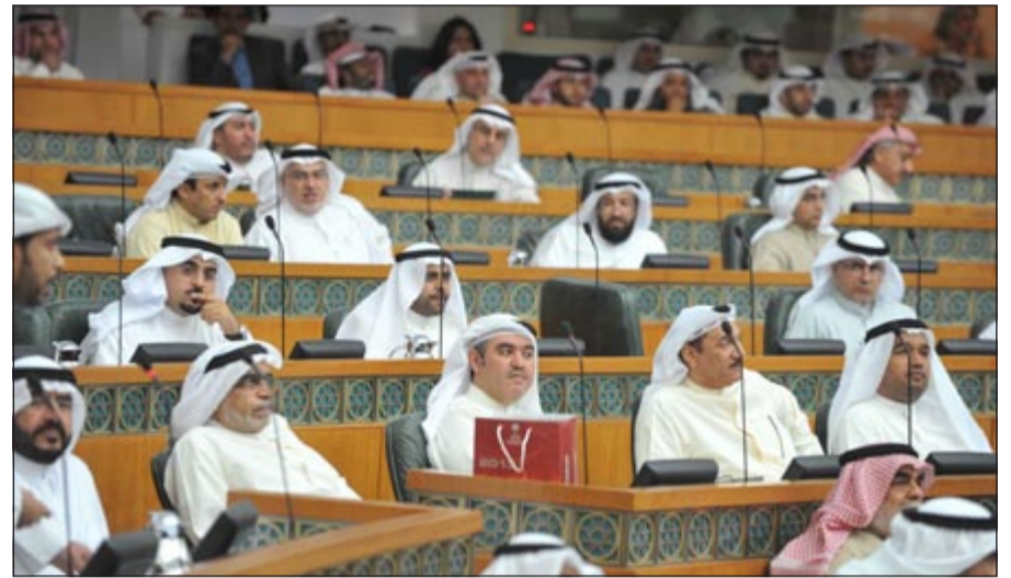
جانب من الجلسة

انصح للتجريح واتمنى ممن يدعو الى حل المجلس ان يقوم بتقديم استقالته.