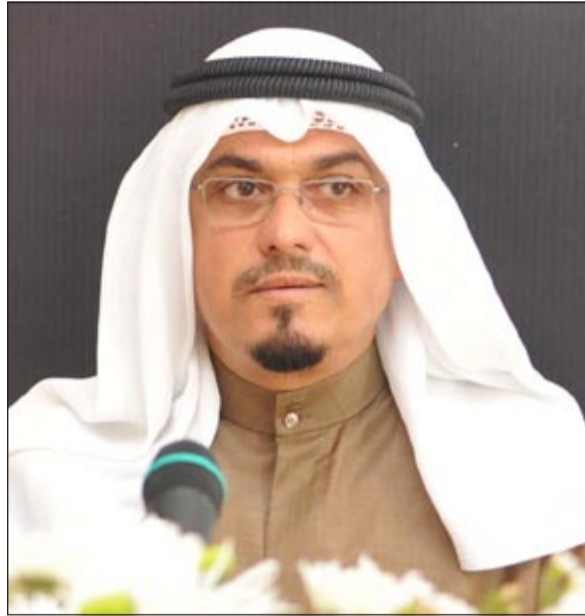
الشيخ د.علي الناصر العلي متحدثا خلال المؤتمر