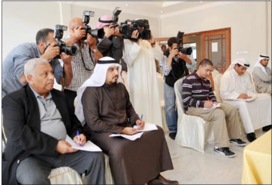
عدد من الإعلاميين يتابعون المؤتمر الصحافي