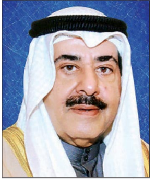
الشيخ أحمد الحمود