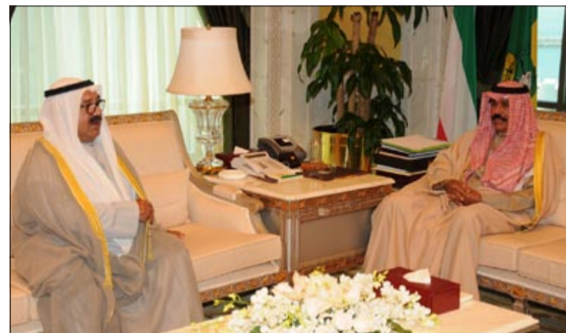
سمو ولي العهد الشيخ نواف الأحمد خلال لقائه الشيخ ناصر صباح الأحمد

الجمهورية الكويتي نحو دور العلاقات العامة في الحكومة الإلكترونية»، وقد شكره سموه، متمنياً له التوفيق والنجاح. واستقبل سموه بقصر السيف ظهر أمس كلا من كاظم حاجي يعقوب معرفي وعبدالله محمد رفيع معرفي ومحمد تقي معرفي وعبدالمطلب عبدالمناف معرفي، حيث أهدوا سموه هدية تذكارية بمناسبة احتفال المدرسة الوطنية باليوبيل الماسي ومرور 75 عاماً على إنشائها كأول مدرسة أهلية في الكويت. واستقبل سمو ولي العهد الشيخ نواف الأحمد في ديوانه بقصر السيف أمس سفير الجمهورية اللبنانية لدى الكويت د.جسام النعماني وذلك بمناسبة انتهاء فترة عمله سفير البلاد. واستقبل سموه سفير جمهورية