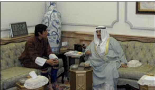
سمو الشيخ ناصر المحمد مستقبلاً ولي عهد بوتان

استقبل سمو الشيخ ناصر المحمد في قصر الشويخ صاحب السمو الملكي الأمير جيجيل أوجن ونغشاك ولي عهد مملكة بوتان الصديقي ورئيس اللجنة الأوبية البوتانية والوفد المرافق له بمناسبة زيارته للبلاد.