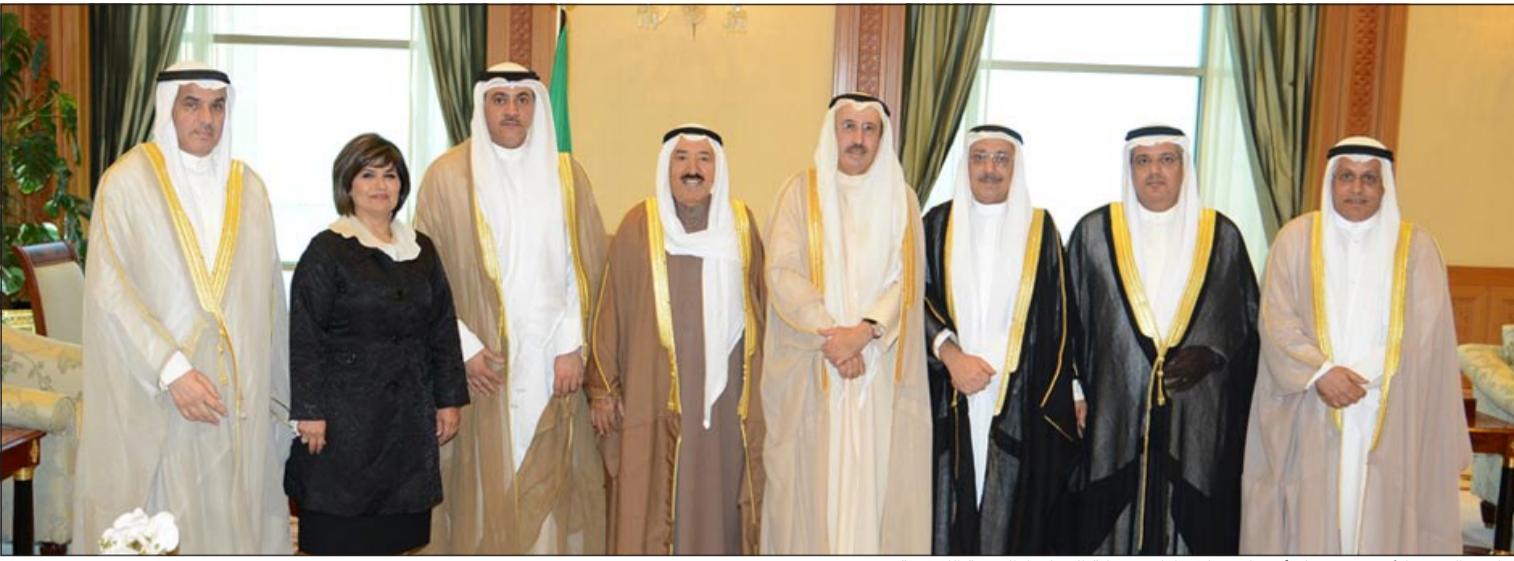
صاحب السمو الأمير مستقبلاً أعضاء مجلس إدارة شركة الخطوط الجوية الكويتية