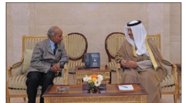
سمو رئيس الوزراء الشيخ جابر المبارك خلال لقائه فهمي أحمد الحاج

استقبل سمو رئيس مجلس الوزراء الشيخ جابر المبارك بقصر السيف أمس مستشار رئيس جمهورية جيبوتي الشقيقة لشؤون الاستثمار فهمي أحمد الحاج، حيث سلم سموه رسالة تذكارية من رئيس وزراء جمهورية جيبوتي دليتا محمد دليتا تناولت العلاقات الثنائية بين البلدين الشقيقين وسبل تطويرها والقضايا ذات الاهتمام المشترك. حضر المقابلة الوكيل المساعد بديوان سمو رئيس مجلس الوزراء الشيخ خالد محمد خالد.