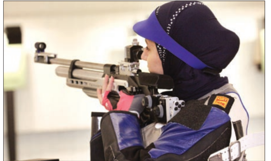
الاستعدادات جاهزة للرميات