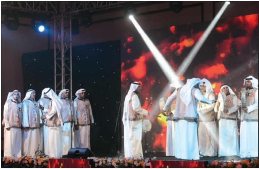
لوحة فنية من التراث قدمت على مسرح البطولة