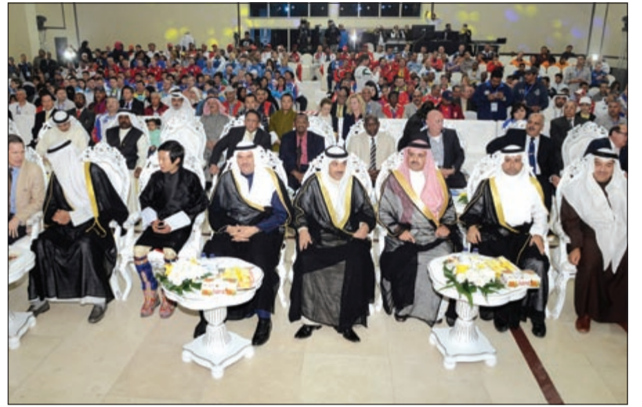
الشيخ سلمان الحمود يتقدم الحضور خلال افتتاح البطولة

الاتحاديين العربي والكويتي للعبة والمتطوعين لتفانيهم وجهودهم الكبيرة لضمان نجاح هذه البطولة. وتضمن حفل الافتتاح عرض أوبريست «في حب الكويت» وكلمة للرامي الأولمبي فهد الديحاني عبر فيها عن شكره لدعم صاحب السمو الأمير للرمية الكويتية ورعايته الكريمة لهذه البطولة. كما تضمن الحفل عرض فيلم وثائقي حول حصول الرامي الديحاني على الميدالية البرونزية في أولمبياد لندن 2012 وبقية الرماة الحاصلين على المراكز الثلاثة الأولى في الأولمبياد ذاته إلى جانب فقرات شعبية فلكلورية.