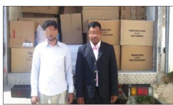
التهمان وخلفهما المسروقات