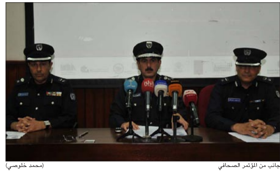
جانب من المؤتمر الصحفي (محمد خلوصي)

بالخارج لرجال الاطفاء يحظى باهتمام مباشر من وزير الدولة لشؤون مجلس الوزراء ووزير البلدية الشيخ محمد العبدالله، لافتاً الى ان الوزير العبدالله يدفع باتجاه اقرار التامين الصحي بالتنسيق مع ديوان الخدمة المدنية، مؤكداً ان اقرار التامين سيكون في القريب. ولفت الى انه سيتم انشاء ناد لرجال الاطفاء واقترحت ثلاثة مواقع وإلى الآن لم يتم اختيار المكان وجار العمل مع الجهات المختصة لاختيار المكان تمهيداً لإنشائه. وأشار العميد المكرد الى ان اعتماد الترقيات لرجال الاطفاء سيكون في موعده ودون اي تأخير وذلك بعد اعداد الميزانية اللازمة. وأكد ان ثلاثة مراكز للاطفاء انشئت وأدخلت الى الخدمة في منطقة كبد وفيلكا بالإضافة الى تجديد مركز اطفاء المطار لافتاً الى انه خلال نهاية العام سيتم الانتهاء من انشاء مركز اطفاء منطقة ام الهيمان. ولفت العميد المكرد الى ان عدد الحوادث خلال عام 2011 بلغ 13495 حادثاً وفي عام 2012 بلغ 15370 حادثاً اي بزيادة 14٪ عن العام الذي سبقه والحرائق بلغت 5207 عام 2011 والعام الذي