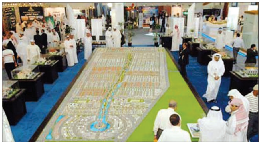
جانب من معرض العام الماضي

ولفت العتيبي إلى أن مشروع الجزيرة الذي تقوم الشركة على تسويقه هو مشروع ملك لشركة بالكامل بعد أن أسست الشركة فرعاً لها في سراييفو، مشيراً إلى