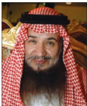
الداعية أحمد القطان