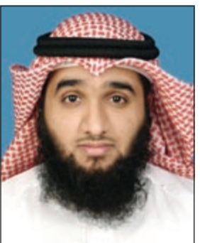
الداعية حسين العيوف

كثير من الآباء والأمهات يلجأون إلى القسوة في عقابهم لأولادهم بدعوى الخوف عليهم من السلوك غير السوي مما يترتب عليه العقاب الجسدي والإيذاء النفسي وينعكس سلباً على الطفل. فما هو العقاب المناسب للطفل حين خطأ؟ حول هذه القضية نتعرف على آراء علماء التربية والنفس والشرع: