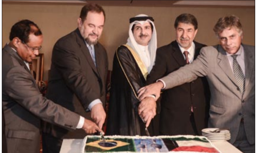
السفير يوسف عبدالصمد يقطع كيكاً الحفل بمشاركة وكيل «الخارجية» البرازيلية وعميد السلك الدبلوماسي العربي

عواصم - كونا: أقامت قنصلتنا في مدينة جدة السعودية حفلاً وطنياً خصص للسيدات بمناسبة الأعياد الوطنية للبلاد (العيد الوطني الـ 52 و عيد التحرير الـ 22) وسط حضور كبير. وذكرت المشرفة على الحفل الوطني حرم قنصلتنا العام في جدة الهام المن في تصريح لـ «كونا» أن الحفل الذي أقيم أمس الأول تحت عنوان «اللبلة الكويتية» جاء تعبيراً عن الفرحة بهذه المناسبات الوطنية الغالية على كل الكويتيين. ورفعت المنذن بهذه المناسبة أسمى آيات التهاني والتبريكات إلى مقام صاحب السمو الأمير الشيخ صباح الأحمد وسمو ولي العهد الشيخ نواف الأحمد. وأعربت عن اعتزازها وفخرها بنجاح الحفل الذي شهد حضوراً نسياً متميزاً