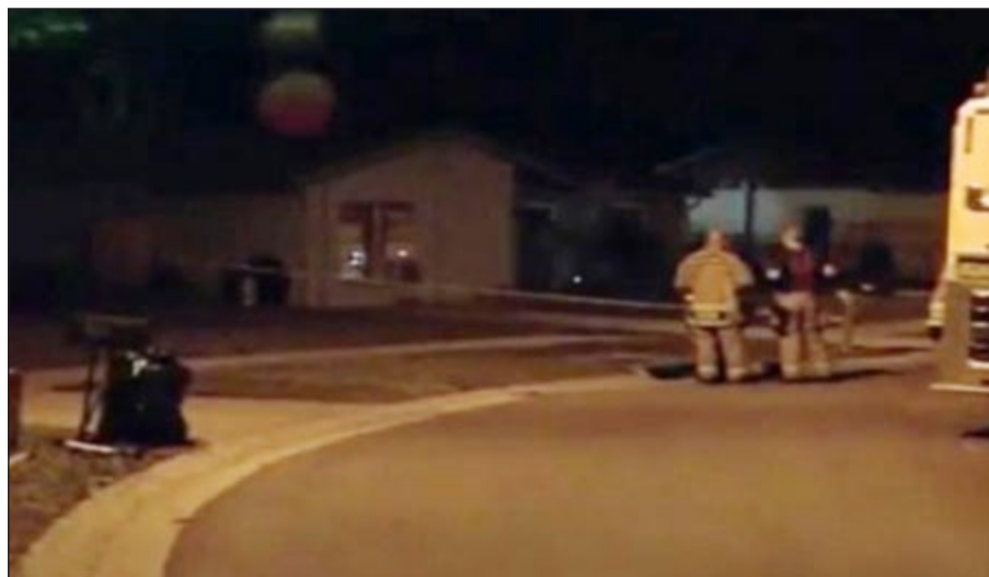
رجال الأمن يحيطون بالفجوة العملاقة

وفي التفاصيل ان الرجل فوجئ بالأرض تبتلعه، فصرخ