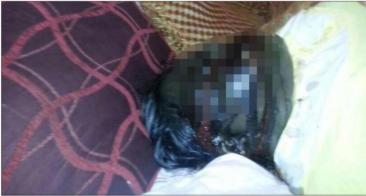
جثة الآسيوية بعد كسر غرفتها

امر مدير امن محافظة الفروانية اللواء عبدالفتاح العلي بأحالة جثة وافدة آسيوية الى الطب الشرعي وسط شكوك كبيرة في مقتلها من قبل قريبين لها غادرا البلاد قبل يومين. وحسب مصدر امني فان وافدة آسيوية ابغنت عمليات الداخلية بانبيعات رائحة كريهة من غرفة تقيم فيها عائلة آسيوية وان الرائحة تتزايد بصورة