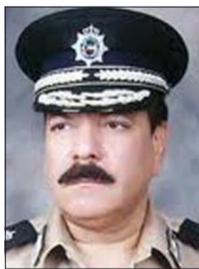
اللواء عبدالفتاح العلي

امر مدير امن محافظة الفروانية اللواء عبدالفتاح العلي بأحالة جثة وافدة آسيوية الى الطب الشرعي وسط شكوك كبيرة في مقتلها من قبل قريبين لها غادرا البلاد قبل يومين. وحسب مصدر امني فان وافدة آسيوية ابغنت عمليات الداخلية بانبيعات رائحة كريهة من غرفة تقيم فيها عائلة آسيوية وان الرائحة تتزايد بصورة