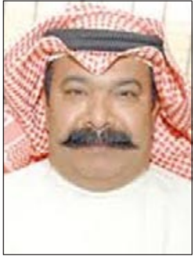
العميد محمود الطباخ