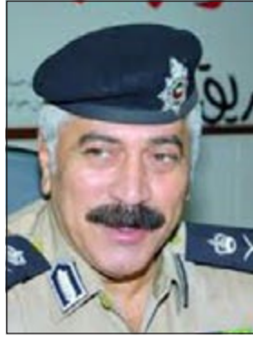
اللواء محمود الدوسري