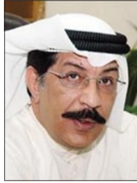
اللواء عبد الحميد العوضي

احتفالات العيد الوطني. وقال مصدر امني: صباح امس فوجئ رجال الامن الاحمدي بدخول شاب كويتي في العقد الثالث من عمره طالبا الإفصاح عن حقيقة ابعدت النوم عن عينه.