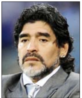
ديغو أرماندو مارادونا

وذكر شنتورك الذي يقطن في بلدة الطن أو، التابعة لقضاء أدرميت في ولاية باليقصير التركية، أنه أطلق اسم ديغو محمد على ابنه البالغ من العمر 7 أعوام، واسم أرماغان أرماندو على ابنه البالغ من العمر سنتين، وأخيرا اكمل الاسم الثلاثي للاعب الأرجنتيني على مولوده الجديد ذي العشرين يوما مطلقا عليه اسم «البتكين مارادونا». وأضاف المواطن التركي انه يعيش اللاعب الأرجنتيني مارادونا منذ نعومة أظفاره، وشاهد جميع مبارياته، ويشاهد بين الحين والآخر الأهداف التي سجلها الأخير. وقال عاشق مارادونا ان كثيرا ممن يسمعون الخبر يستغربون من اطلاقه هذه الأسماء على أولاده، لكنهم يتقبلون الأمر ويسعدون بهذا خاصة محبي كرة القدم منهم.