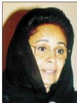
الشبيخة لطيفة الفهد

الموافق لها بعد مشاركتها في المؤتمر الرابع لمؤتمر المرأة العربية. وشددت الشبيخة لطيفة الفهد على ضرورة مشاركة المرأة في الخطط التنقيضية للدول بما يتيح تواجد المرأة في شتى المجالات. وقالت انها حرصت في كلمتها في المؤتمر على أن تتوصل أفكارها واقتراحاتها لأعضاء المنظمة العربية للمرأة وهي الأفكار التي تحتاج في تفعيل واليات لتنفيذها في أرض الواقع لتكون في خدمة