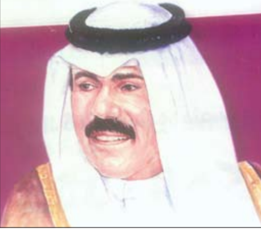
صورة لسمو ولي العهد الشيخ نواف الأحمد

هلست علينا هذه الأيام الذكرى السابعة لتولي سمو الشيخ نواف الأحمد ولاية العهد، والذي حظي بثقة صاحب السمو الأمير الشيخ صباح الأحمد. ولعل مسيرة سمو الشيخ نواف الأحمد كأحد أعمدة بيت الحكم هي مسيرة وطن من خلال المسؤوليات والمناصب التي تقلدها والتي من أهمها: محافظ حولي - وزيراً للدخلة - وزيراً للشؤون - وزيراً للدفاع - نائب رئيس الحرس الوطني - وصولاً الى ولاية العهد.