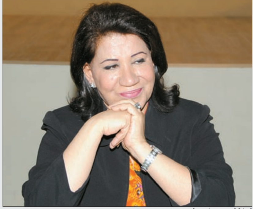
الفنانة القديرة سعاد عبدالله

هذا ويقام مهرجان المسرح العربي للطفل في دورته الأولى في الفترة من 19-7 مارس الجاري وتقام عروضه على عدة صالات مسرحية في الكويت.