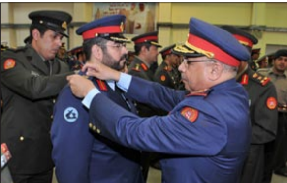
الفريق الركن خالد الجراح يقلد أحد الضباط رتبته الجديدة

أقيمت امس برعاية وحضور رئيس الأركان العامة للجيش الفريق الركن خالد الجراح مراسم تقليد كوكبة من الضباط من الدرجة 18 رتبة عقيد، وتقليد الضباط من الدفقات (24 - 25 - 26) رتبة مقدم، وذلك تنفيذًا للمراسيم الأميرية الصادرة من صاحب السمو الأمير القائد الأعلى للقوات المسلحة الشيخ صباح الأحمد. وأعرب رئيس الأركان في كلمة وجهها الى الضباط المرقيين عن بالغ التقدير للثقة الغالبة التي أولاها