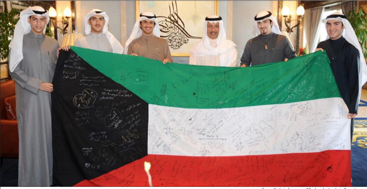
سمو رئيس الوزراء يتسلم علم الكويت من أعضاء الجمعية