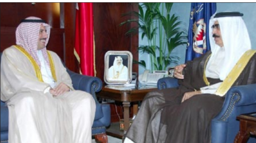
الوزير الشيخ عزام الصباح خلال لقائه الفريق ركن الشيخ راشد بن عبدالله آل خليفة

الاستقرار والأمن. من جانبه قال السفير عزام الصباح ان الكويت تدعم الحوار التوافقي في مملكة البحرين بما يؤدي الى السلم الاجتماعي والأمن هو كل لا يتجزأ، مشيدا بما بلغته العلاقات الكويتية - البحرينية من رقي في المجالات كافة.