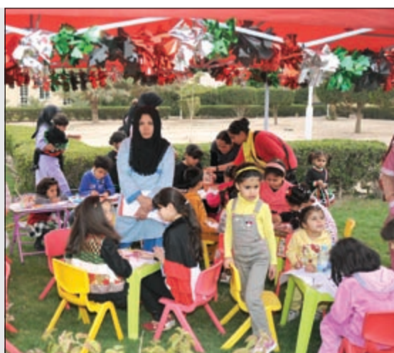
فرحة افتتاح الحديقة النموذجية الصديقة للبيئة لم تكتمل

مخربون أفسدوا إبداعات «الحديقة النموذجية الصديقة للبيئة»