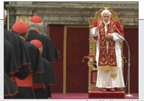
البابا في خطابه الأخير أمس

واشنطن تدعم الجيش الحر مباشرة والخطيب: العالم مهتم بلحي المعارضين أكثر من ضحايا النظام 31