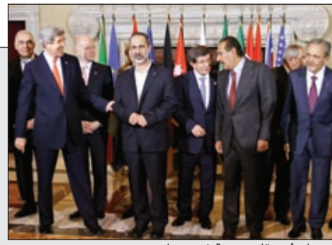
اجتماع اصدقاء سورية في روما