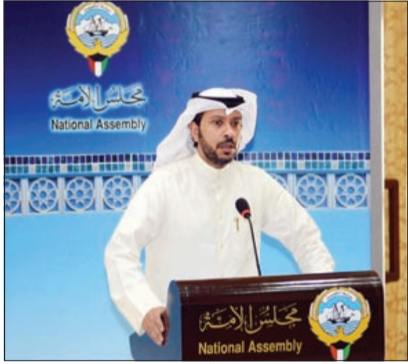
نواب الفرع خلال المؤتمر الصحفي أمس

الفرع: ماضٍ في استجواب وزير المالية ولن أراجع ما لم تحل قضية القروض جذرياً