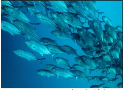
هجرة جماعية لأسماك التونة