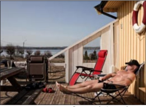
سجن «باستوي» في إحدى جزر النرويج

واحدة». وقالت في معرض وصفها أسلوب العلاج «سيكون المحتوى السلبي للحلم من خلال التخيل لإعادة كتابته كشيء إيجابي». ولابد أن يدون المرضى الحلم ثم يقوموا بتغييره بطريقة يصبح معها لا يمثل عيبا. بعد ذلك لابد أن يقوموا يوميا «بتخيل» النسخة الثانية وبحسب ما يستغرق ذلك، عليهم أيضا «التدريسي على مسارات جديدة للذاكرة»، إلى أن يستخلص المخ تلقائيا النسخة الإيجابية الجديدة. أما المجموعة التي تستخدم طريقة المواجهة، فتتم مواجهة المرضى بطريقة واعية بالمحتوى المرغز لحلمهم. ولابد أن يمثل هؤلاء الأشخاص في أذهانهم الحلم طويلا إلى أن يبدأ الخوف لديهم في التلاشي أي عمليا يصبحون معتادين على المشكلة.