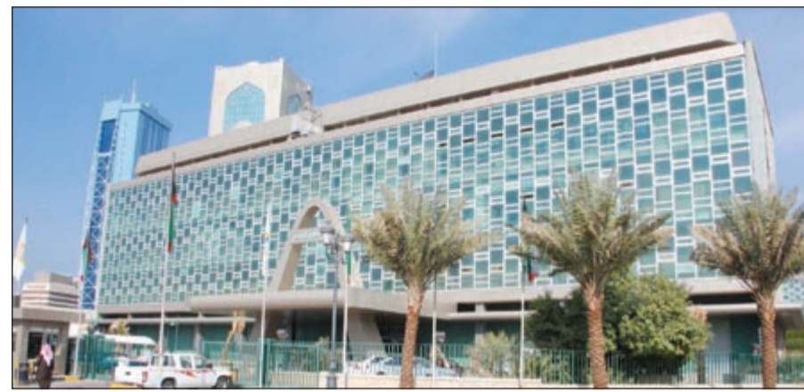
المجلس البلدي استفتى الفتوى والتشريع في أسئلة الجهاز الفني للبلدية

القانون 5 لسنة 2005. وعلى جانب آخر، أكدت المحكمة الدستورية في قرارها التفسيري الصادر بجلسته 2005/4/11 في الطلب رقم 3 لسنة 2004 في شأن تفسير نص المادة 99 من الدستور المتعلقة بالسؤال البرلماني انه: «لا يجوز أن يكون من شأن السؤال البرلماني التدخل في أمور مثارة أمام القضاء أو ما يتعلق بأحكام قضائية بما يتعارض واستقلال القضاء واختصاص السلطة القضائية بما معناه انه يمنع على عضو مجلس الامة التقدم بسؤال برلماني وهو أول وسائل الرقابة البرلمانية وأخفاها أثرها في أمور معروضة على القضاء أو ما يتعلق بأحكام قضائية لما قد يثيره من مظنة التأثير على القضاء، وهو أمر محظور دستورياً.....» فالثابت أن البنود المشار إليها تخرج عن الاختصاص الحصري المقرر للمجلس البلدي بموجب المادة 12 من