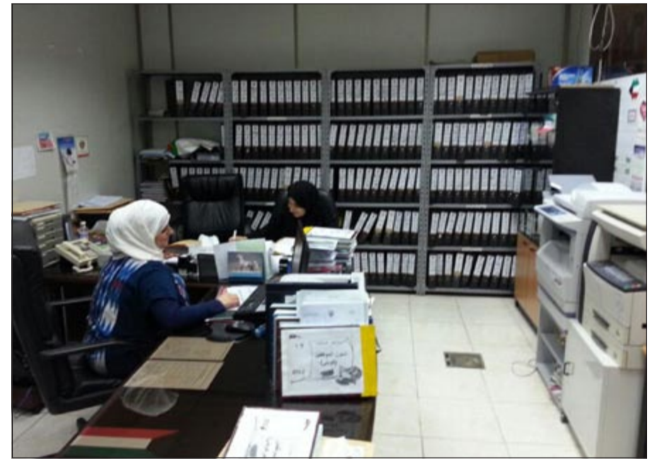
دوام عادي في «الصحة»

مسؤوليهم المباشرين في وزارة الصحة بإنصافهم بالتقييم السنوي للموظفين، وتقييمهم بما يرضي الله عز وجل والابتعاد عن المحاباة في هذا الخصوص، وذلك لأن العديد من الموظفين مجتهدون، وبالتالي لا يتم تقييمهم تقييما يليق بهم، ويتم تقييم الأقل منهم بتقييم امتياز. وتساءل بعض الموظفين عن موضوع صرف مكافآت للموظفين المتميزين في الوزارة والذي تم طرحه في الفترة الماضية، قائلين: انه أصبح «مكانك راوح» ولا أحد يتحدث عنه، مطالبين بمكافآت تميزهم وتشجعهم على العمل.