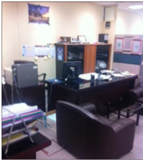
مكاتب خاوية في «الأشغال»

طيبة، لكن في الاصل لم تكن هذه الاعذار صحيحة بل كانت حججا يتحججون بها، حيث ان الغالبية العظمى من المسؤولين غضوا النظر عن ذلك ومنهم من جامل على حساب ومصلة العمل والمواطن من اجل ارضاء شريحة بعينها او موظفين محسوبين عليهم. ولوحظ ان بعض المسؤولين في الوزارة يتزاورون فيما بينهم الامر الذي جعلهم وكأنهم في يوم راحة. كما ان اجهزة البصمة الخاصة بالموظفين كانت هي الأخرى في راحة تامه، حيث لم تزج هي الأخرى من اصابع الموظفين كعادتها يوميا. أضف الى ذلك مواقف السيارات التي كانت خالية تماما سواء التي كانت في السراييب او الأخرى الموجودة امام مبنى الوزارة عكس ما كانت عليه في الأيام الرسمية، حيث كانت تعج بالسيارات كما ان باحة