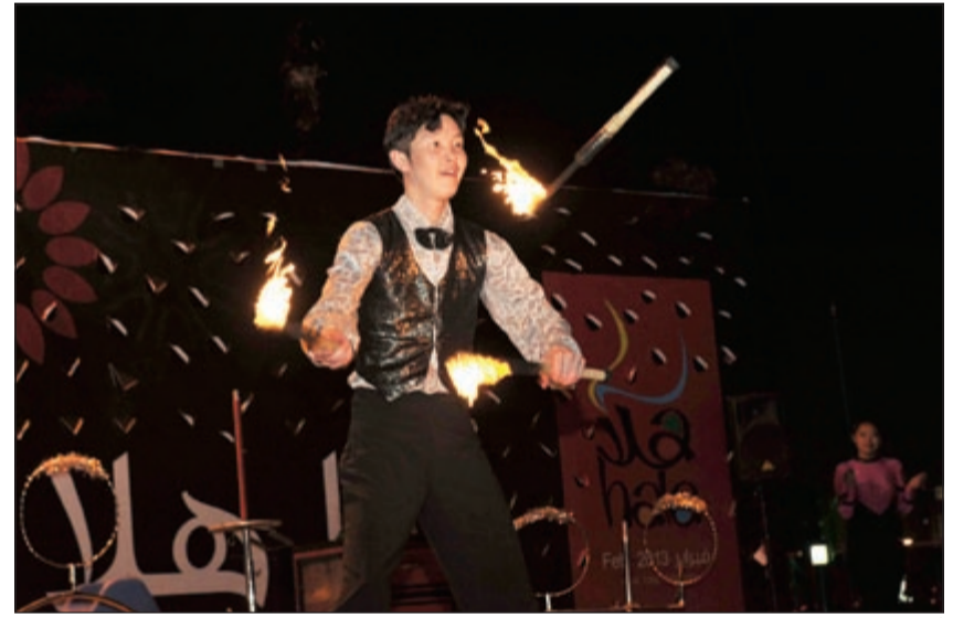
أحد عروض السيرك

شهدت عروض «سيرك زين» التابع لمهرجان هلا فبراير 2013 تحولاً مفاجئاً في حجم الإثارة والدهشة والرقي لجمهور المتابعين، حيث سحرت العروض المتابعين الذين وصفوها بالرأفة.