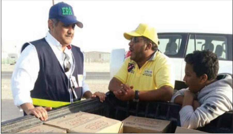
د.صلاح المضحي خلال مشاركته في حملة ضبط الفوم

تمكنت الهيئة العامة للبيئة خلال فترة الأعياد من تطبيق قرار منع استخدام الفوم عبر التفتيش والمتابعة الدائمة عن طريق فرق الضبطية القضائية التي تمكنت من رصد كميات من الفوم سواء في الاسواق او مع الباعة المتجولين في المخيمات او في المصانع. وقد ترأس مدير عام الهيئة د.صلاح المضحي هذه الفرق التي قامت بالتفتيش ما قبل الأعياد وأثناء المسيرات عبر مجموعة كبيرة من الموظفين الذين قاموا بمخالفة كل من باع أو اشترى أو استخدم تلك المادة الضارة للصحة العامة.