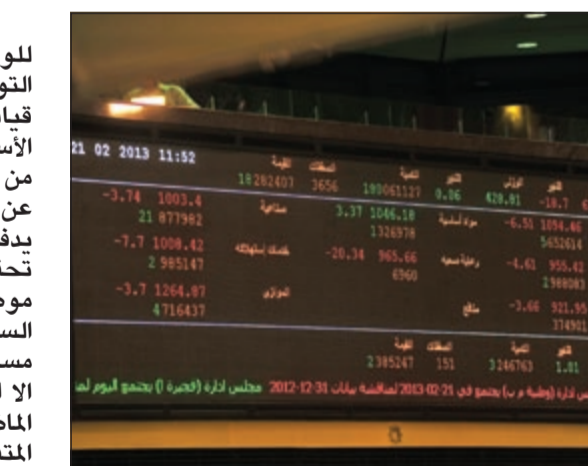
البورصة تحقق مستوى دعم جديداً عن 6409 نقاط

وأشار تقرير «الأولى للوساطة» إلى أن تنامي التوقعات بشأن التوزيعات، قياسياً إلى مستويات الأسعار الحالية دفع العديد من المستثمرين إلى التخلي عن الانجذاب البيعي الذي يدفع السوق أحياناً إلى تحقيق تراجع حاد، موضحاً أنه رغم تذبذب السوق ومؤشراته وتراجع مستويات السيولة المتداولة، إلا أن تعاملات الأسبوع الماضي عكست المزاج المتفائل للمستثمرين.