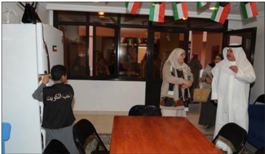
جولة داخل دور الرعاية