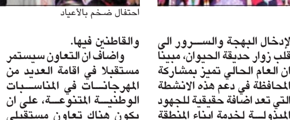
احتفال ضخم بالاعیاد