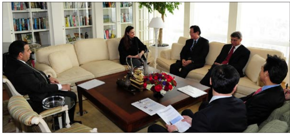
جانب من لقاء مبعوثة صاحب السمو الأمير درولا دشتي مع نائب رئيس المؤسسة الكورية للتنمية كيم جوهون

في توسعة مشاركة الشركات العالمية في الاستثمارات المباشرة بالمشروعات التنموية ضمن خطة التنمية. ونقلت عن رئيس مجلس إدارة كيبكو تطلع الشركات الكورية المعنية بالبني التحتية والكهرباء والطاقة المتجددة التي تعمل في السوق الكورية حاليا ومنها شركته إلى تعزيز التعاون مع المؤسسة وزيادة الاستثمارات المباشرة فيها «ورحبنا بذلك». يذكر أن كيبكو شركة كورية وطنية لديها خبرة في العديد من المشاريع المتعلقة بإنشاء محطات الطاقة بما فيها الطاقة النووية والطاقة المتجددة وتسعى إلى دخول الأسواق العالمية ولديها عدد من مشاريع الطاقة في كل من السعودية والأردن وأكبرها في دولة الإمارات العربية المتحدة (أربع محطات للطاقة النووية بتكلفة 40 مليار دولار). وتسعى الشركة إلى إبرام