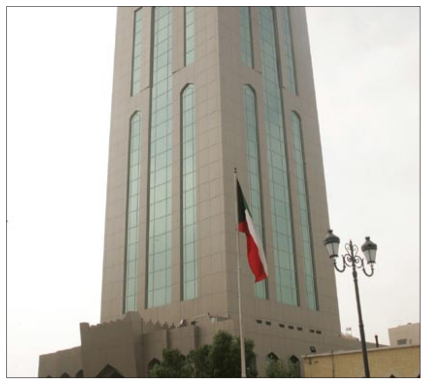
دورات تدريبية وهندسية لموظفي البلدية

الفئة المستفيدة جميع العاملين في مجال السلامة المهنية ومن تتطلب طبيعة عملهم الإلمام بهذا الموضوع.