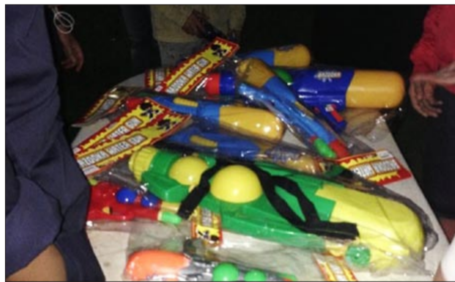
جانب من المواد المصادرة